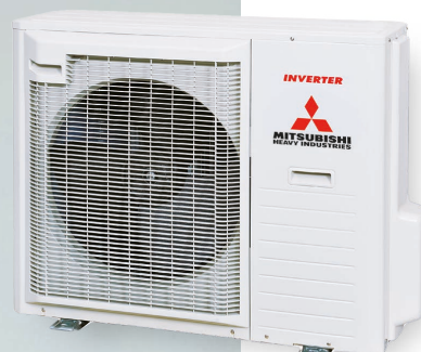
SRC71ZR-W, SRC80ZR-W RAL7044