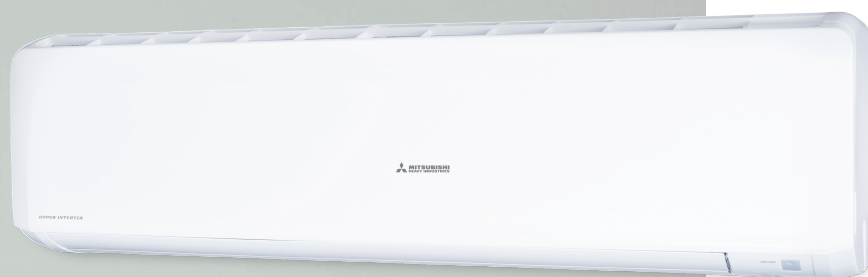
SRK63ZR-W, SRK71ZR-W, SRK80ZR-W RAL9003